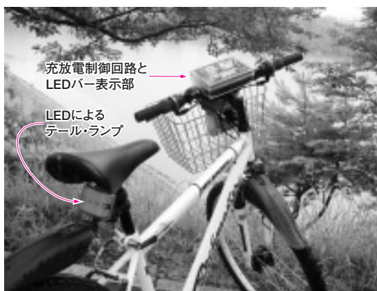
写真15-1 発電のようすがバー・グラフで表示されるテールランプ・システム

しかし、負荷があることは間違いありませんから、発電していることを(できれば積算電力も)表示すれば、