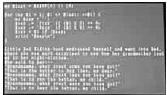
(b) テキスト表示部分