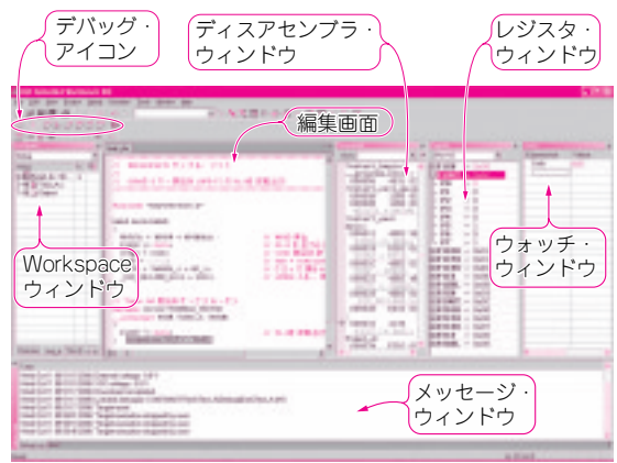
図2 統合開発環境 EW430のデバッグ画面 アセンブラ・ソース・コードによるステップ動作、さまざまなデバッグ情報などを表示可能