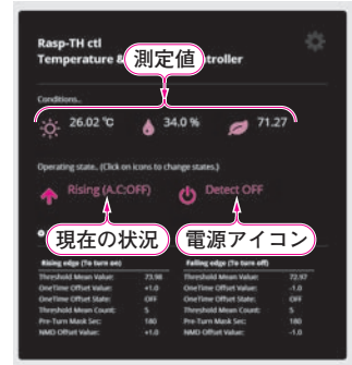
(b) おまけで作った操作画面