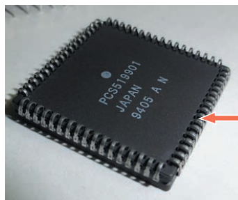
写真1の(a)と(b)で年代を分けて、いろいろな形

身の回りの家電製品には必ずといっていいほどICが使われています。製品を開けて基板を見てみると、昔と今とははっきり様変わりしています。特にICについては、その機能や内部回路はもちろんですが、パッケージもまた大きく変化してきました。