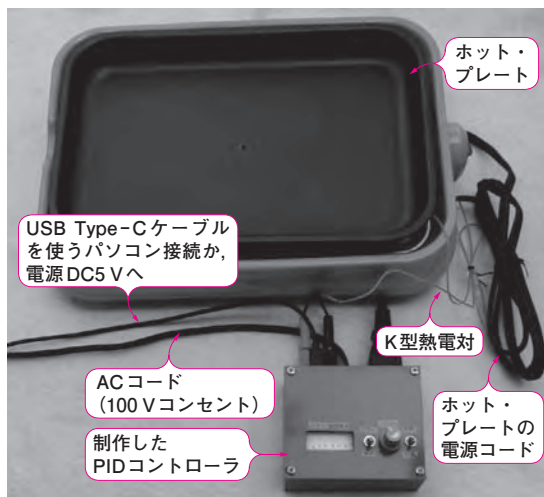
写真1 自作リフロー装置 PICマイコンを用いて製作したPIDコントローラとホット・プレートで構成

表1より、最大制御電力がAC100V 10Aでホット・プレートなどの熱機器の温度をPID制御できます。使用したマイコンPIC16F18857は、PID制御に必要なA-D/D-Aコンバータ、基準電源などの基本機能を搭載(後述)します。