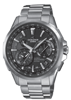
(a) 太陽光で動く電卓 (b) 太陽光で動く腕時計