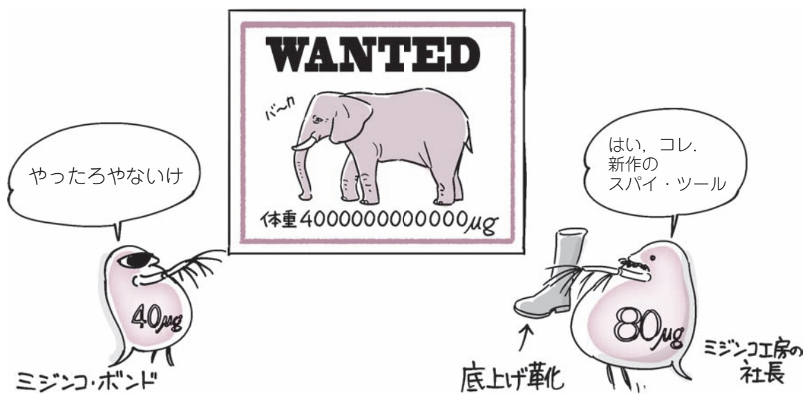
図1 先月号のキロワット級パワー・エレクトロニクスから一転！今月号はマイクロワット級の電子回路の世界を旅する

前号(2015年1月号)の特集「電流ドバツ！電源・パワエレ実験室」では、迫力満点！数百～数千kW級の電子回路を紹介しました。今月は一転して、mW～μWクラスのマイクロワット電子回路の世界を旅します(図1)。数十mVから起動する電源の誕生やICの低消費電力化のおかげで、自然エネルギーを電気に変える発電デバイスを使って、電池もケーブルもない自立電源をもつマイクロワット電子回路が作れるようになっています。