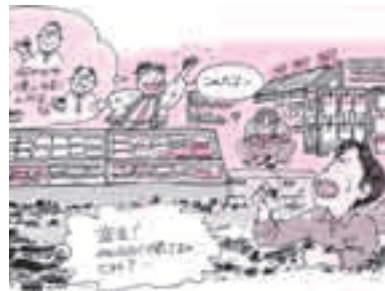
図1 部品を販売している企業に一番引き合いが多い部品を聞きました

今回紹介する売れ筋No.1のICの中には、比較的新しいものも含まれていますが、多くは、理由はともあ