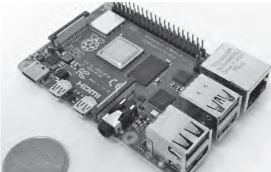
写真1 定番の小型コンピュータ・ボード「ラズベリー・パイ4」は遠隔ロボットのメイン・コントローラとして十分に活用できる