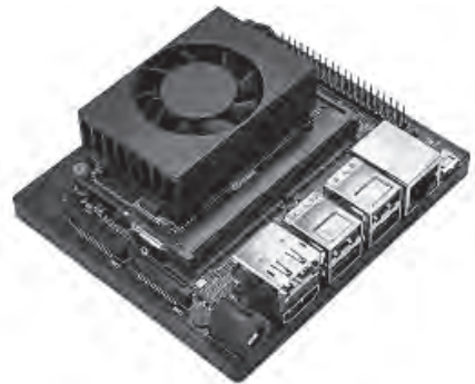
写真2 最大21TOPSの演算性能をもつ小型スパコン Jetson Xavier NX(NVIDIA)

画像認識などのAI処理を高速に実行したいときは、本器を使うのも1つの手段