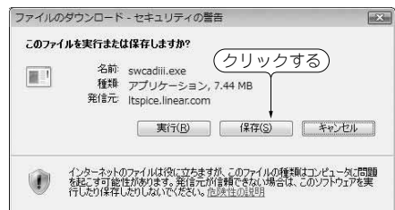
図 1-3 ダウンロードする実行ファイル swcadiii.exe は保存しておく