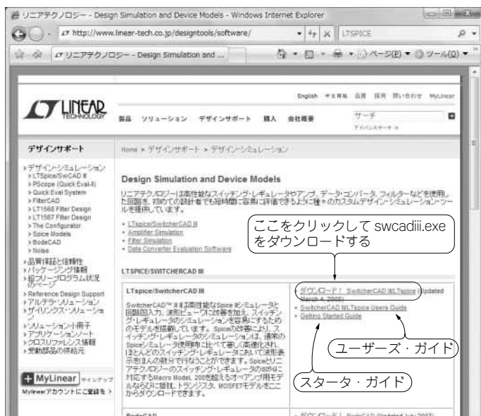
図1-1 LTspice/SwitcherCAD IIIのダウンロード・サイト

LTspiceのインストール・ファイルswcadiii.exeはLTspiceリニアテクノロジーのウェブ・ページ内にある、図1-1に示すデザイン・シミュレーションのページからダウンロードできます。