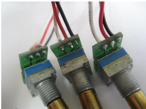
写真 15 訂正：電線の色は左から「白・黒・赤」が正しい