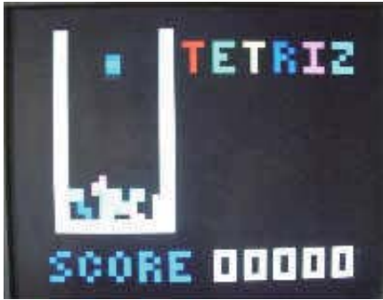
テトリスの画面（例）