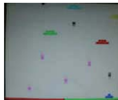
シューティングの画面（例）

次々に現れるUFOを撃ち落とします。遠くのUFOほど得点が高いよ。UFOから落とされる爆弾をよけながら、うまく撃ち落とせるかな？