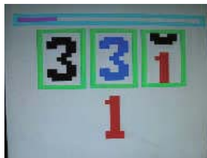
スロットの画面（例）

スロットゲームです。数字が合うか、色が合うと得点になります。「1 2 3」や「4 5 6」のように、続き番号でも得点になります。「7 7 7」で全部同じ色の時が最高得点です。10回トライして合計点を競います。