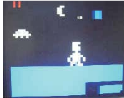
エスケープーの画面（例）