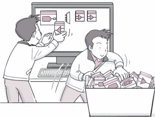
図1 PSoC Creatorを使えばまるで電子ブロックのように直感的に回路を設計できる あらかじめ用意されたできあいの回路の素「コンポーネント」をブロックみたいにエディタ上に置いていく

一度触ってみれば、その魅力に気づくはずです。ぜひ一度インストールし、ユーザ思いな巧妙な作りと、まるであの電子ブロックのような直感的な開発作業を体験してください。