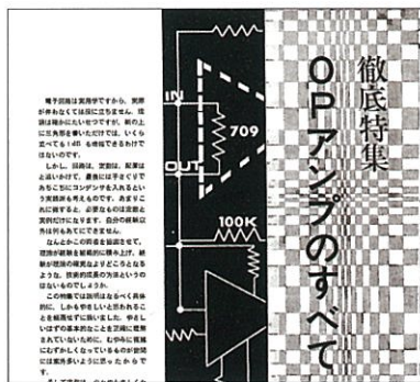
図2 通巻100号 1973年1月号特集 「OPアンプのすべて 岡村 勉 著」を収録

復刻版につき、保守・廃品種が含まれています。また、メーカーによっては予告なく規格や外形を変更している場合があります。最新の資料でご確認ください。