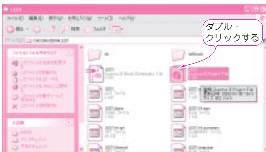
図1 Quartus II 評価版にHDLソースを読み込む c:\¥CQ¥tr0604¥LED1 フォルダを開きLED1という名前のQuartus II Project Fileをダブル・クリックする

Project Fileとなっているファイルがあります。これをダブル・クリックすると、Quartus IIが起動して、LED1というプロジェクトが開きます(図2)。