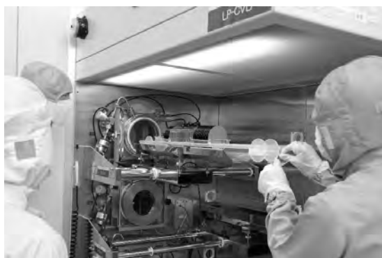
(b) クリーン・ルーム内の写真