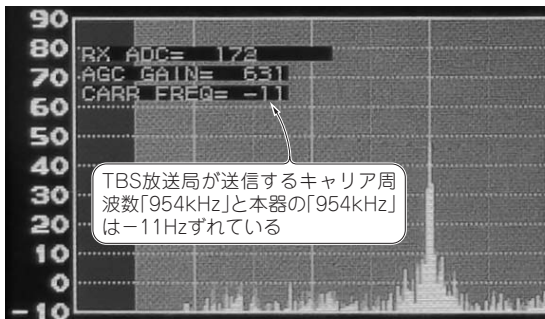
図1 SDR-3のスペシャル・ファンクション① プレジジョン周波数カウンタの+LCD表示 放送電波のキャリア周波数と内部クロック周波数の差分を算出して表示

というわけで、電波のキャリア周波数を常にモニタして、LCDモニタに表示することにしました(図1)。