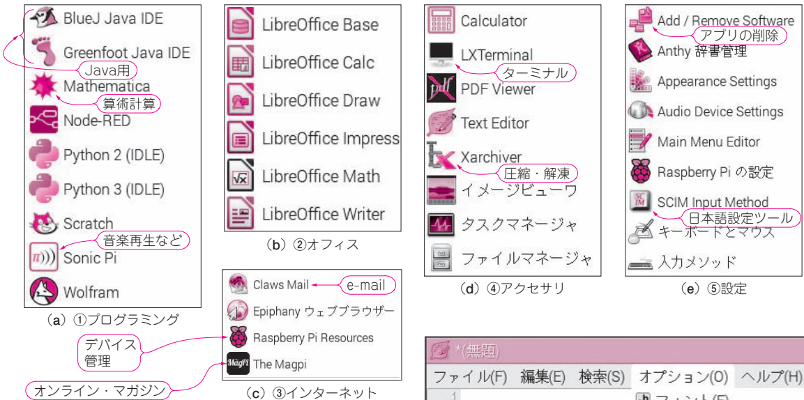
図1 ラズベリー・パイ専用Linux Raspbianが標準装備している無料アプリケーションのいろいろ(ほかにもたくさんある)

ラズベリー・パイにRaspbianをインストールすると、図1に示すさまざまなアプリケーションが自動的に組み込まれます。本章では、その中からお勧めのアプリケーションを紹介します。