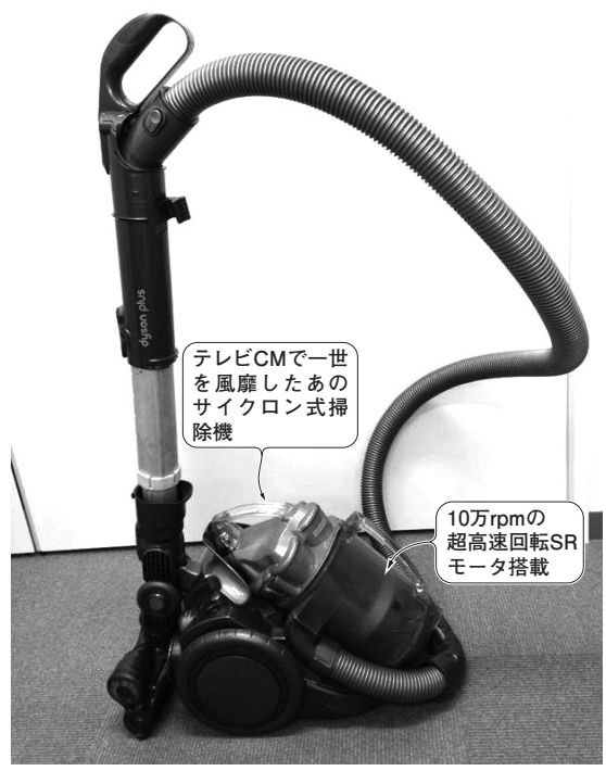
写真1 10万rpmのSRモータを搭載した掃除機DC12(ダイソン)

● 10万rpmで回せるSRモータを採用 テレビCMで一世を風靡した吸引力の変わらない掃除機, キャニスタ型掃除機DC12(ダイソン)は10万rpmのSRMを採用していました. 写真2は, DC12を