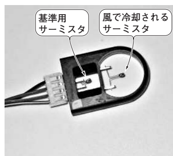
写真2 自作した風速センサ

今回は、風速センサのリニア補正時に使用する風洞器を作りました。小型の風洞内で正確な風速を作成するのは大変です。そこで、プロペラの回転数と風速がある範囲内ではある程度比例したこと(過去に実験した結果)を利用して、プロペラの回転数を定速制御します。