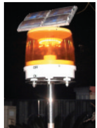
写真3(2) LED防蛾灯の実験