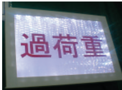
写真2(2) 工場内の表示装置