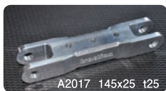
A2017 145x25 t25