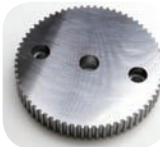
S50C φ115 t16