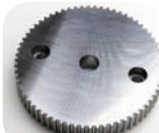
S50C φ115 t16