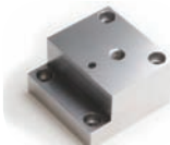
SS400 70 x 65 t50